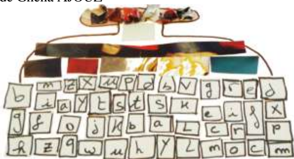
TORMOT POS de Ghena AJOUZ

Je suis Tormot Pos, je suis un torchon qui tord les mots négatifs, en effaçant quelques lettres afin de les transformer en d'autres mots positifs.