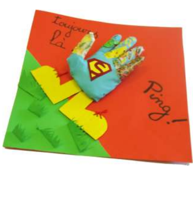
SUPER-MAIN de Cynthia TOHME

Durant ses voyages, LE PETIT PRINCE sentait toujours un besoin d'un coup de main pour résoudre les problèmes, et les conflits. Un jour, par hasard, en pensant il disait :